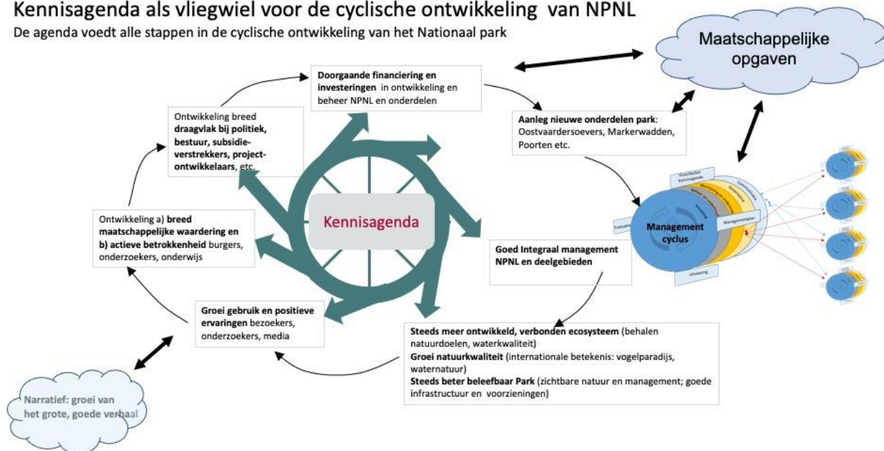
Figuur 1 Kennisagenda als vliegwiel voor de cyclische ontwikkeling Nationaal Park Nieuw Land, werkgroep Onderzoek Nationaal Park Nieuw Land in samenwerking met Wing 2020

De agenda voedt alle stappen in de cyclische ontwikkeling van het Nationaal park