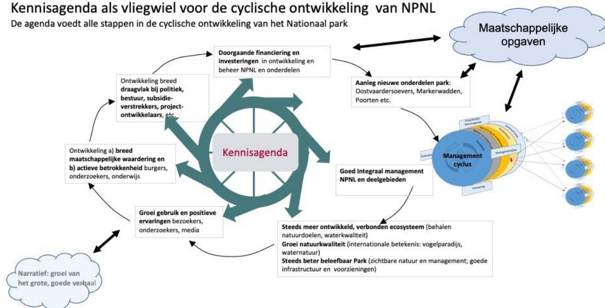
Figuur 1 (idem p7) Kennisagenda als vliegwiel voor de cyclische ontwikkeling Nationaal Park Nieuw Land, werkgroep Onderzoek Nationaal Park Nieuw Land in samenwerking met Wing 2020

De agenda voedt alle stappen in de cyclische ontwikkeling van het Nationaal park