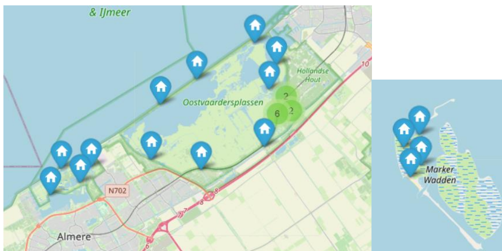
Figuur 1 en 4 Kijkhutten en uitkijkpunten Oostvaardersplassen

Er zijn veel verschillende soorten onderzoekspunten beschikbaar in Nationaal Park Nieuw Land, net als ontmoetingsplekken voor onderzoekers.