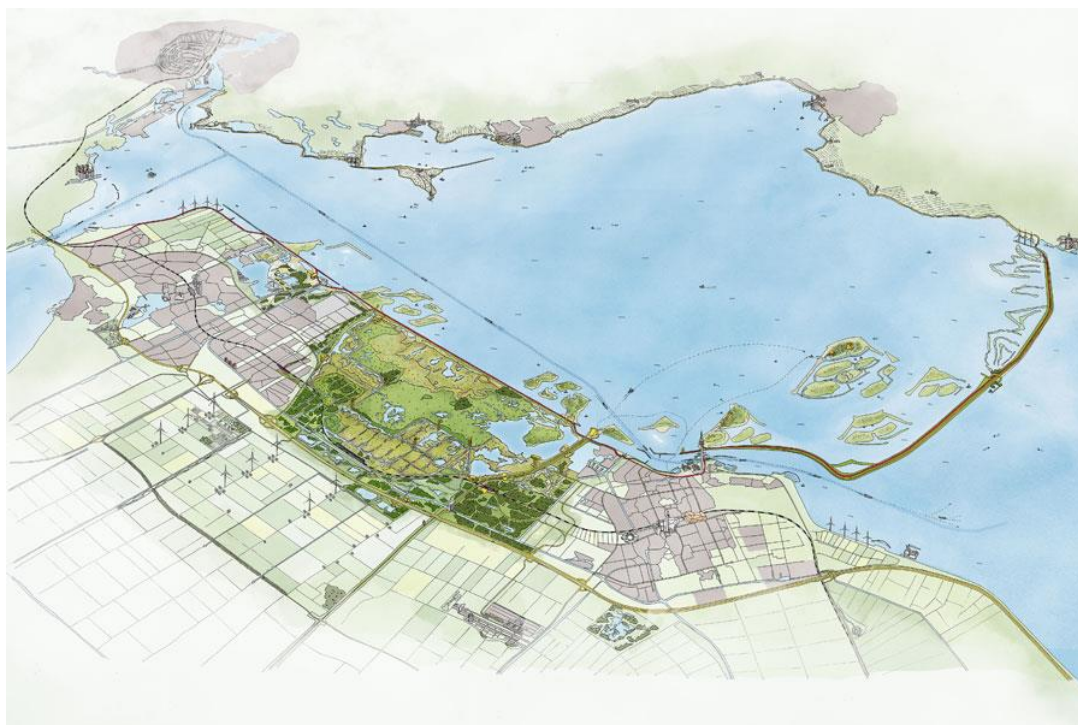
Figuur 2 Overzicht gebied Nationaal Park Nieuw Land. Uit de Ontwikkelingsvisie Nieuw Land 2019

Nationaal Park Nieuw Land is sinds oktober 2018 het nieuwste Nationaal Park in Nederland. De Lepelaarplassen en de Oostvaardersplassen en hun omgeving, Marker Wadden en het Markermeer bundelen hun krachten en vormen samen Nationaal Park Nieuw Land.